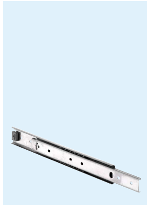
Stainless steel Acier inoxydable Edelstahl